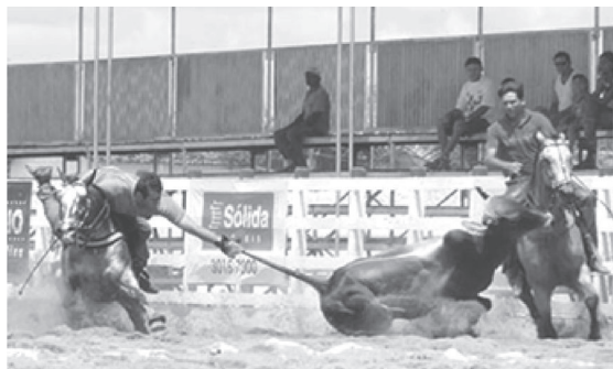
Figura 1. Derrubada do boi

Os cavalos montados pelos atletas percorrem a pista em velocidade, e não raramente observam-se atletas caírem de seus animais violentamente ( figura 2 e 3 ). O membro superior do puxador sofre intenso estresse predispondo a lesões, visto que o atleta tenta derrubar o boi que pode pesar mais de 300 kg.