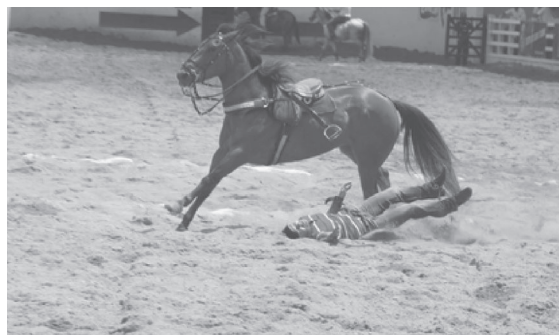
Figura 3. Queda após a derrubada do boi