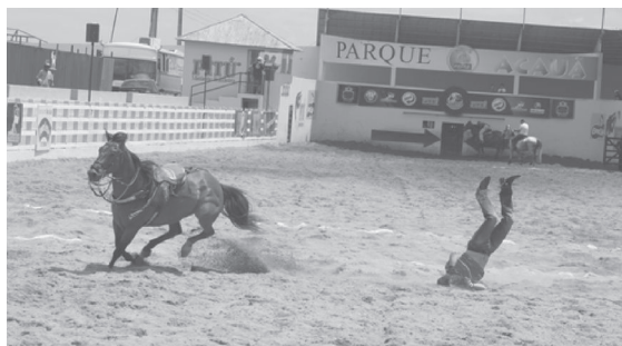
Figura 2. Acidente com risco iminente de lesão

Os cavalos montados pelos atletas percorrem a pista em velocidade, e não raramente observam-se atletas caírem de seus animais violentamente ( figura 2 e 3 ). O membro superior do puxador sofre intenso estresse predispondo a lesões, visto que o atleta tenta derrubar o boi que pode pesar mais de 300 kg.